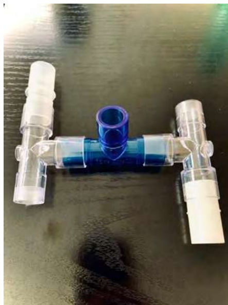
Figura 2: Cuatro pacientes / ventilador: 2 T + M / M / M