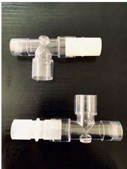
Figura 1: Dos pacientes / ventilador = 2 conexiones